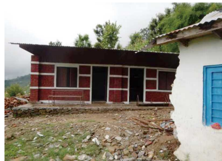
学校運営委員会が建設した校舎